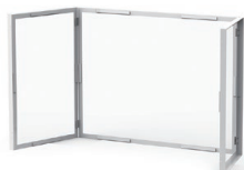
最大開時 幅1248mm 奥行473mm