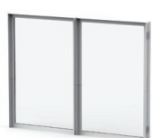
折りたたみ時 幅930mm 奥行67mm