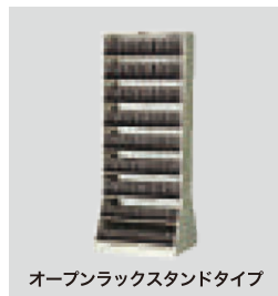
オープンラックスタンドタイプ

標準価格 482,000円(税別) W955×D400×H1790(mm) 重量 127.0kg 収納媒体/8mm キャビネット収納巻数(5段)/420巻(1棚当り60巻) 棚板仕様/前列スタンド×2個、後列スタンド×3個、棚段数7段、スタンド35個