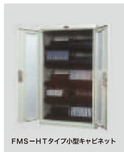
FMS-HTタイプ小型キャビネット

標準価格 312,000円(税別) W680×D500×H1160(mm) 重量 66.0kg 収納媒体/8mm キャビネット収納巻数(3段)/144巻(1棚当り48巻) 棚板仕様/上段仕切り固定板、下段仕切り固定板、棚段数3段