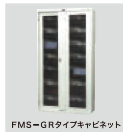
FMS-GRタイプキャビネット

標準価格 391,000円(税別) W955×D400×H1790(mm) 重量 120.6kg 収納媒体/8mm キャビネット収納巻数(5段)/360巻(1棚当り72巻) 棚板仕様/上段仕切り固定板、下段仕切り固定板、棚段数5段