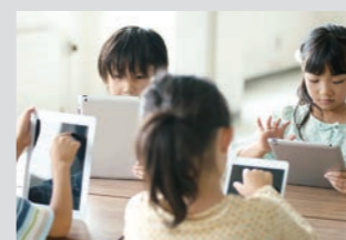
教育用タブレットの充電に