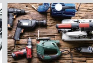
充電式工具の集中充電に