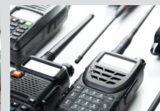
無線機・トランシーバーの充電に