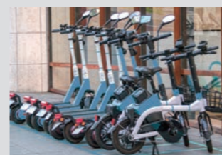
電動キックボードの充電に