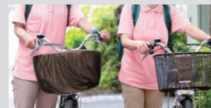
訪問介護の電動アシスト自転車の充電に