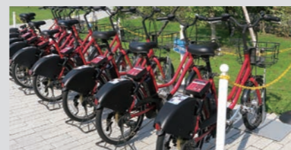
シェアサイクル用電動アシスト自転車の充電に