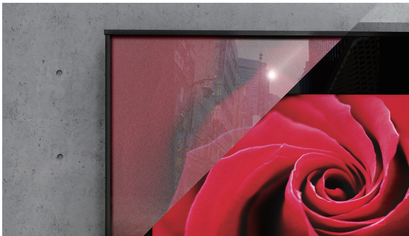
▲一般保護ガラス(左)とclearad(右)の比較イメージ

高透過低反射の保護ガラスを用いたサイネージ。 屋外における反射や映り込みを軽減し、美しい映像を。