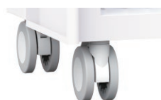
キャスター【FDCCP-1004】 100φの大型双輪キャスター。 前方2か所はストッパー付きです。