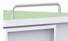
取っ手【FDCCP-TT02】 保管庫を移動させる際に便利な 取っ手です。