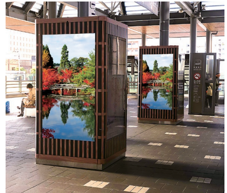
デザイン筐体イメージ