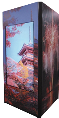
印刷(シート)イメージ