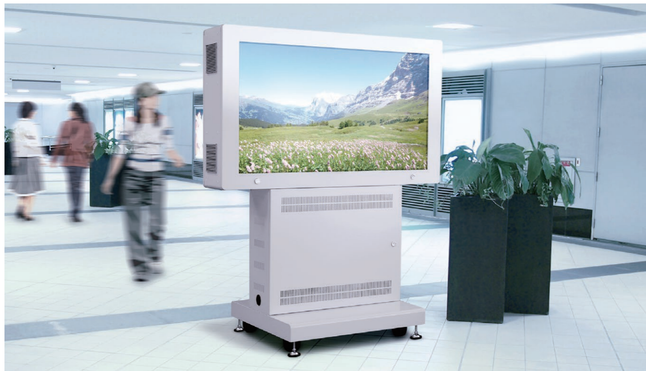
▲55V型 ヨコ設置例 (FFP-ICS-X2-55)